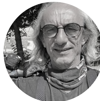
TONTON DIDOU BANDE SON